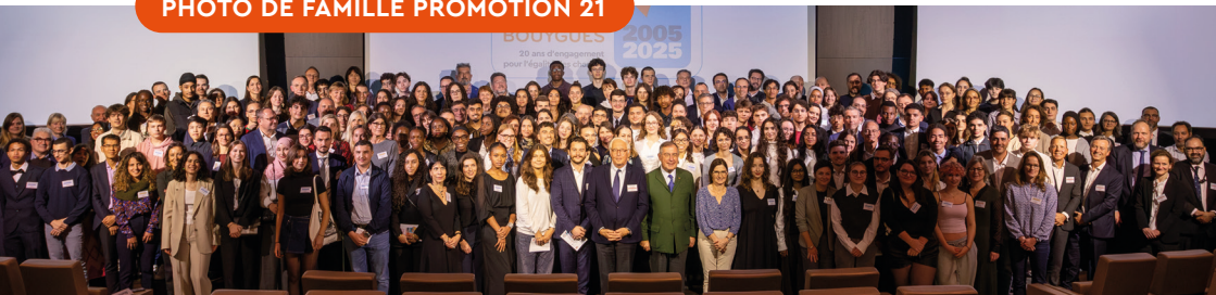
PHOTO DE FAMILLE PROMOTION 21

agence RUS | Crédits photos : © Arnaud Février - © Dorien Prost Imprimé en le-de-France sur papier issu de forêts gérées durablement